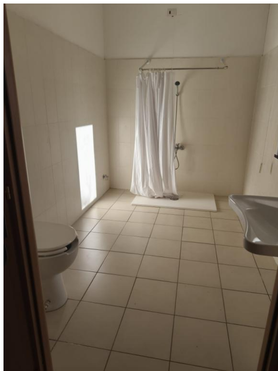
Sala lavaggio assistito