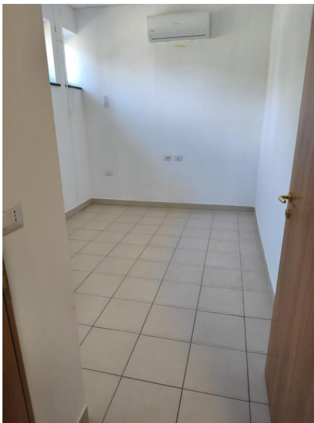
Sala per visite mediche